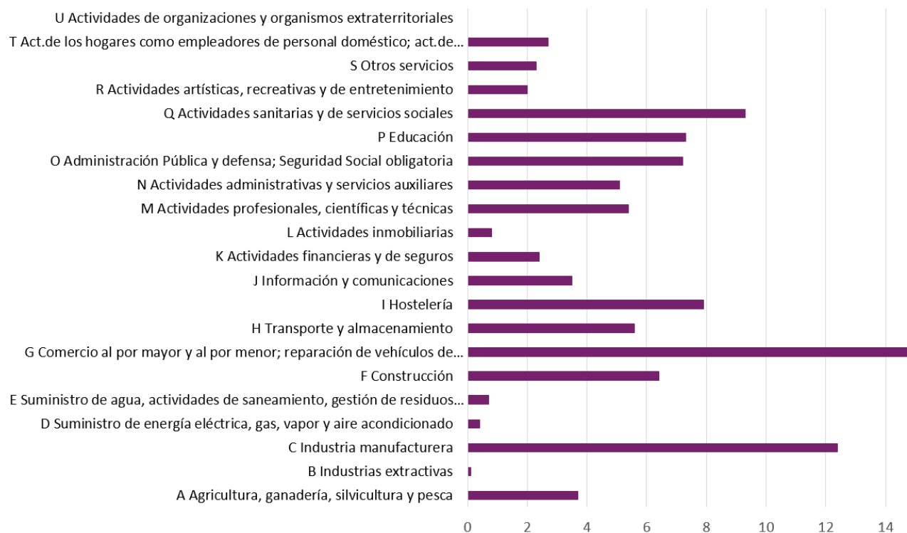
Figura 2.2: Personas ocupadas por rama de actividad 4T 2022 en el Estado español

En cualquier caso, el análisis de los puestos de trabajo actuales por sectores económicos, arroja que el sector del empleo de hogar es responsable del 2,66% de la ocupación laboral, según la EPA 8 del último trimestre de 2022.